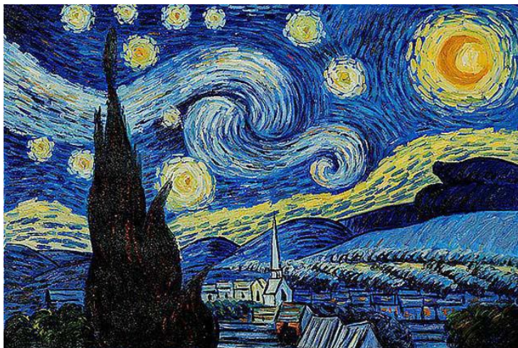
(Винсент Ван Гог, Звездное небо)

Пуантилизм ( фр. Pointillisme , буквально «точечность», фр. point — точка), направление в живописи неоимпрессионизма , возникшее во Франции около 1885 года , в основе которого лежит манера письма отдельными мазками правильной, точечной или прямоугольной формы. Характеризуется отказом от физического смешения красок ради оптического эффекта.