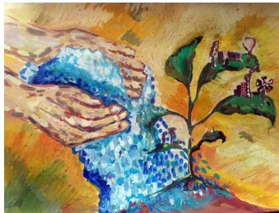
Асадуллина Милина 76, Живая вода, рук. Магалимов Р.Ф.

завершенной. Следующий шаг это переход к письму посредством пятен т.е. к работе в технике пуантилизма. Пятна могут быть различными не обязательно повторять великого Ван Гога, главное сохранить сам принцип последовательного наложения пятна. Цвета можно не смешивать, но примерную репетицию необходимо провести на палитре обязательно. Вот пришло время первых пятен на полотне, первые шаги самые волнующие Поступательными движениями наносим серию пятен. После того как краска в кисти начинает заканчиваться или же пятна становятся не такими игривыми и бодрыми, необходимо снова набрать цвет слегка поменяв тональность. Как говорил один из моих учителей в живописи важна живопись, само слово говорит само за себя о том что важно живо писать или же каждое наносимое художником пятно должно быть живым и цвета наносимые должны играть друг с другом и создавать общее цельное восприятие гармонии.