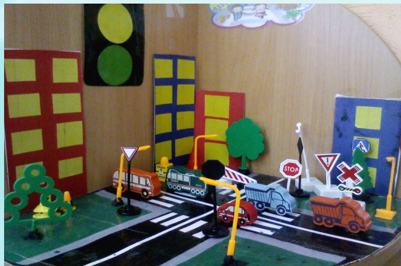
Макет проезжей части