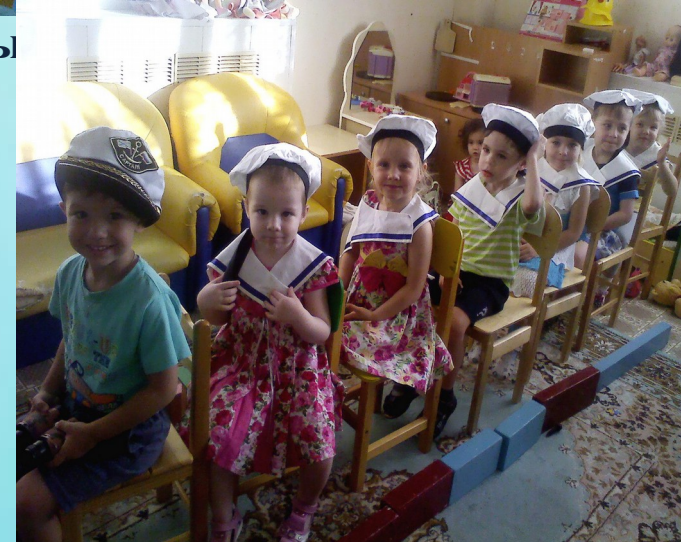
Полифункциональное использование мебели