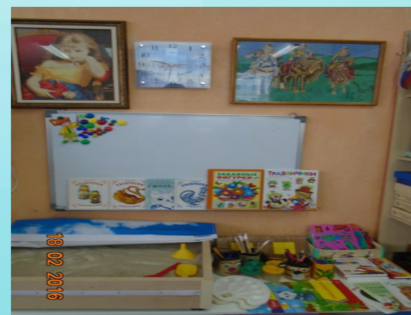
Зона художественного творчества