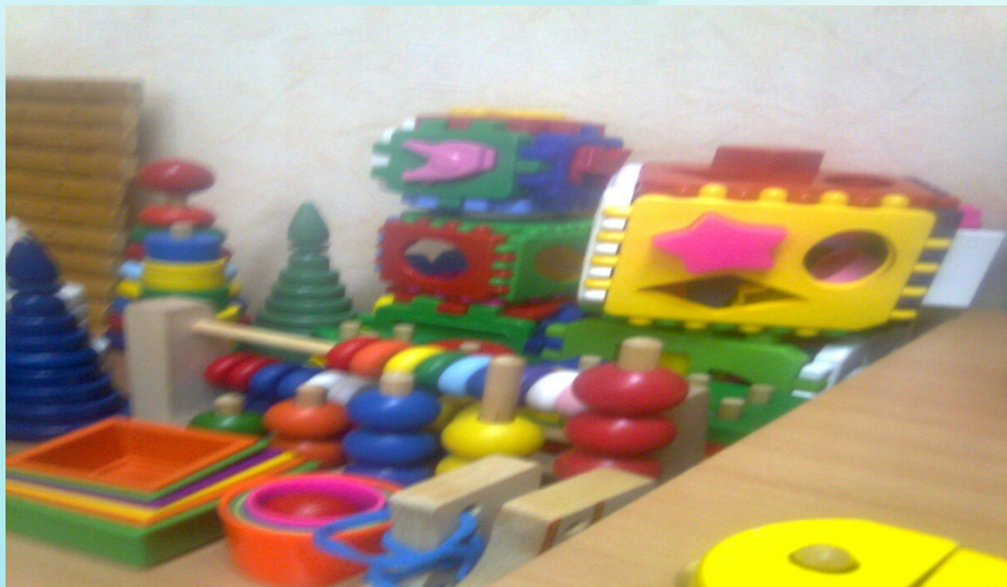
Пирамидки, вкладыши деревянные, шнуровки