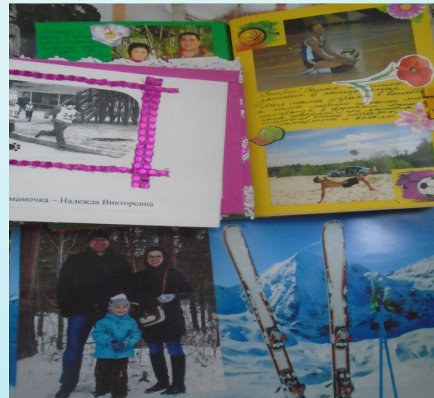
Альбомы «Мы любим спорт»