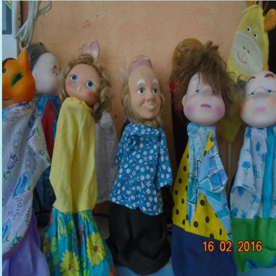
Перчаточный кукольный театр