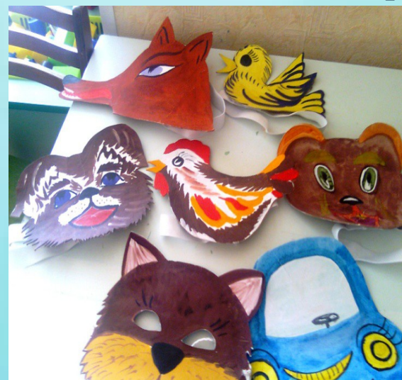
Маски к подвижным играм