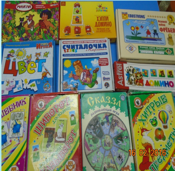
Настольно-печатные дидактические игры