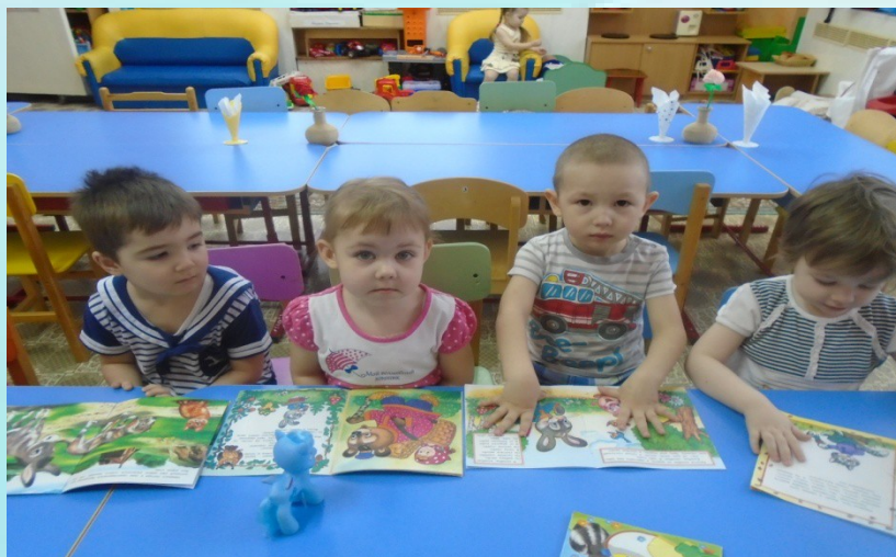
Рассматривание любимых книг