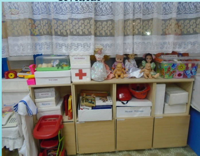
Центр сюжетно –ролевых игр