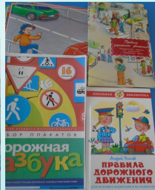
Книги по ПДД