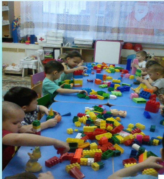
Наборы «лего», конструкторы