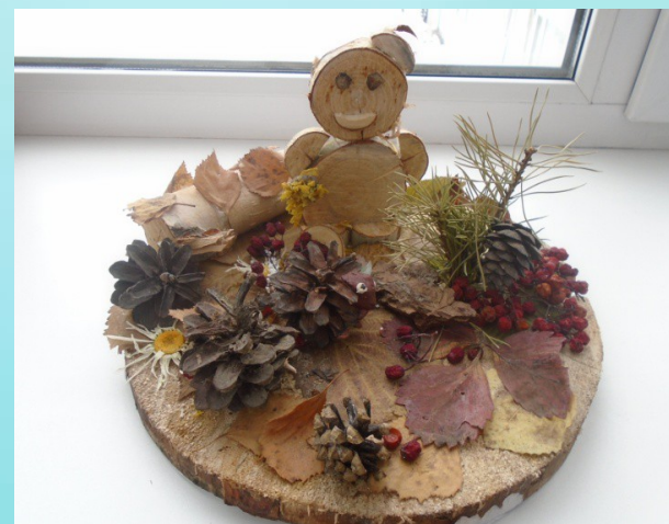
Поделки из природного материала