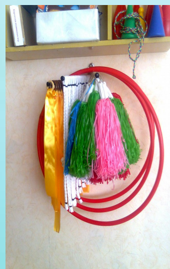
Гимнастические ленты, веревочки,