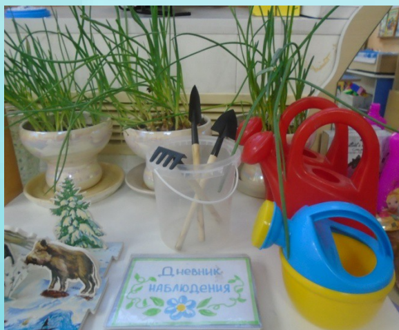
Инвентарь по уходу за растениями