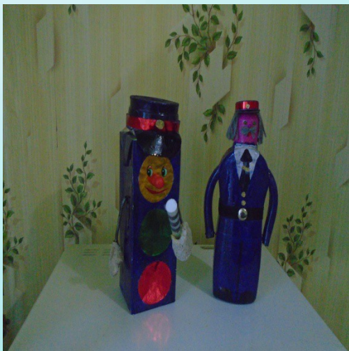
Дидактические игры по ПДД