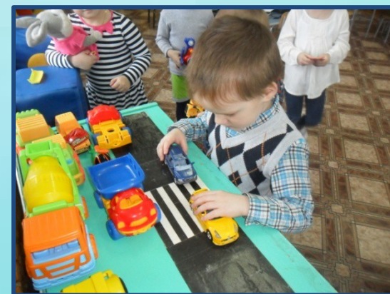
Игры с машинами