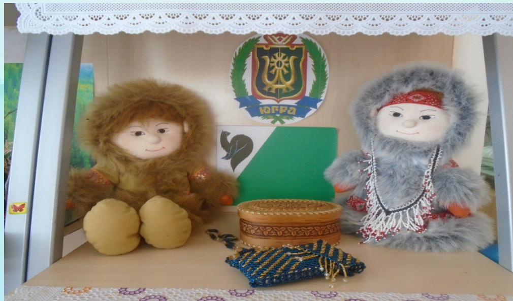
Куклы в национальных одеждах ханты