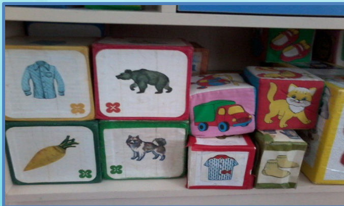
Кубики с предметными картинками