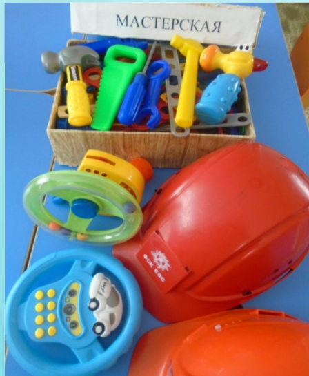
Дидактические и сюжетно-ролевые игры