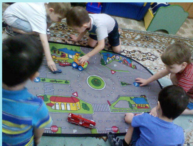
Использование макета городские дороги