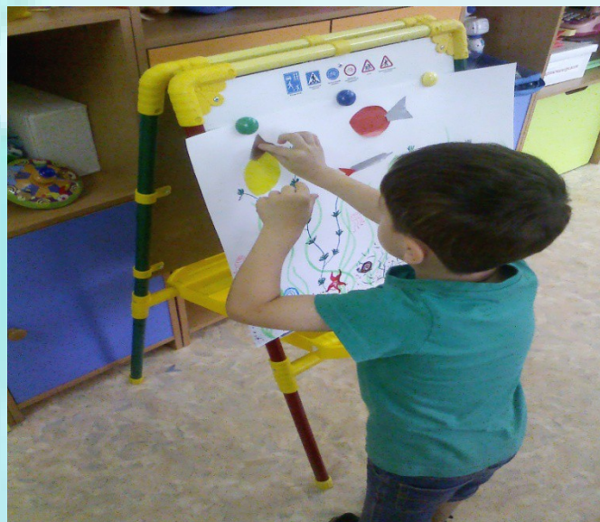
Коллективная аппликация «Аквариум»