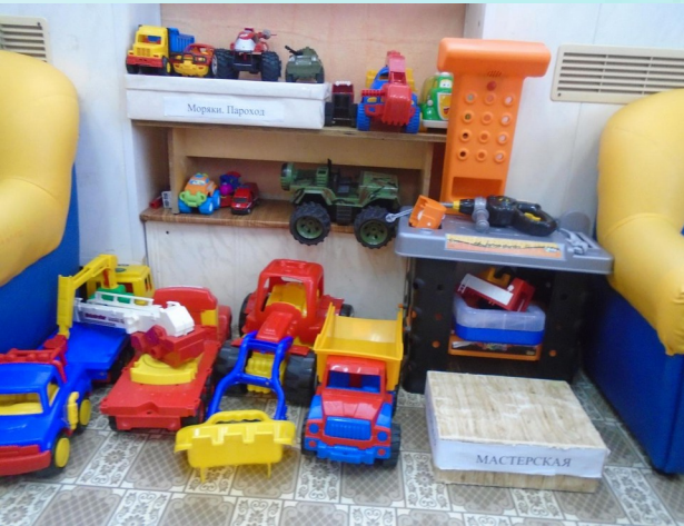
Гараж со спецтранспортом