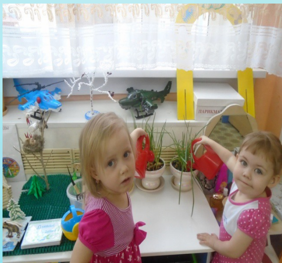
Уход за растениями