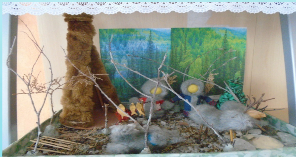
Среда обитания ханты и манси