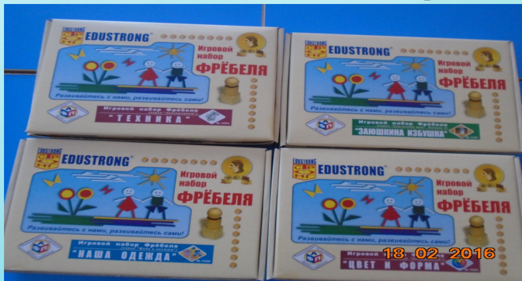
Дидактические игры «Фребеля»