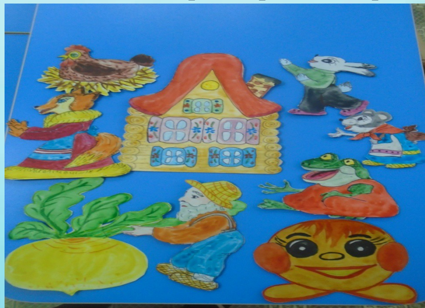
Любимые герои сказок на фланелеграфе