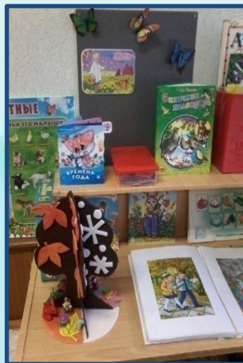
Дидактическое пособие «Дерево времен года»