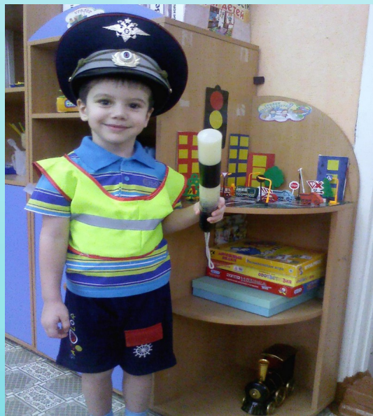
Настольно-печатные игры по ПДД