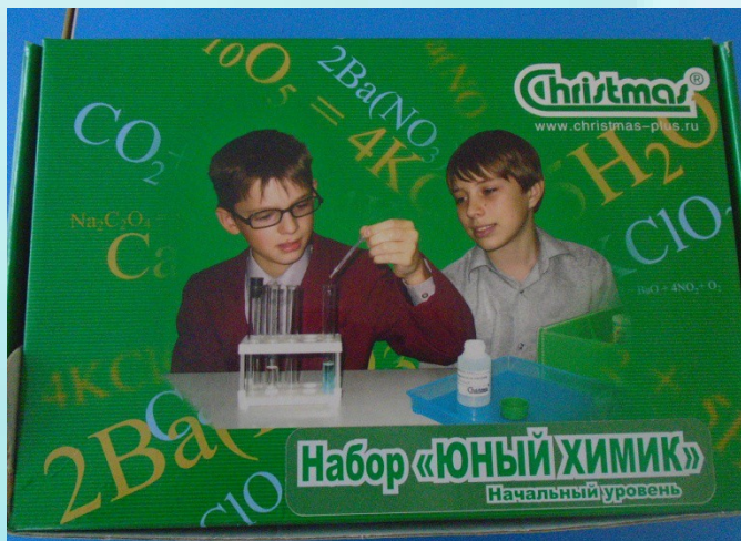
Набор для исследований