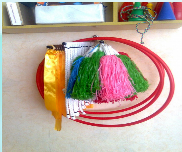
Гимнастические ленты, веревочки, султанчики