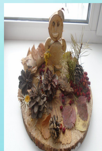
Поделки из природного материала