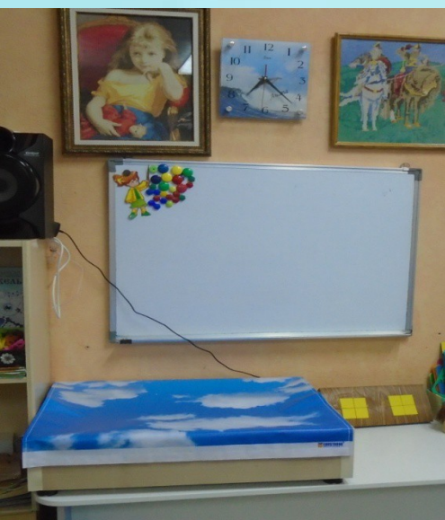
Песочница с подсветкой для рисования