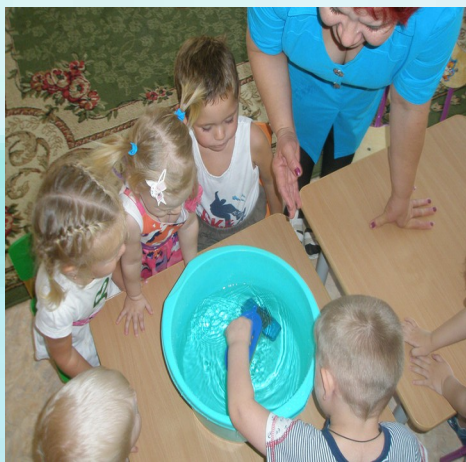
Опыты с водой