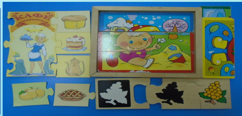
Дидактическая игра «Составь картинку»