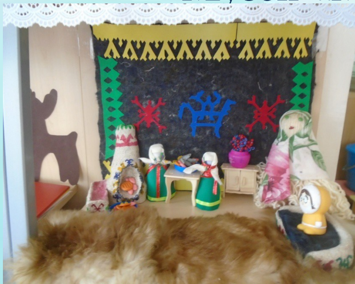
Жизнь и быт ханты и манси