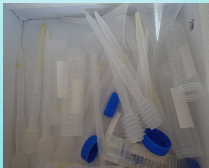
Оборудование для лаборатории