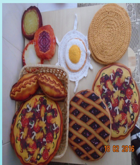
Выпечка для кукол