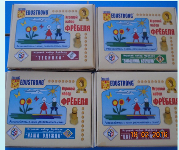
Наборы настольно-дидактических игр Фребеля.