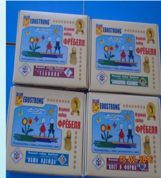
Дидактические игры Фрeбеля