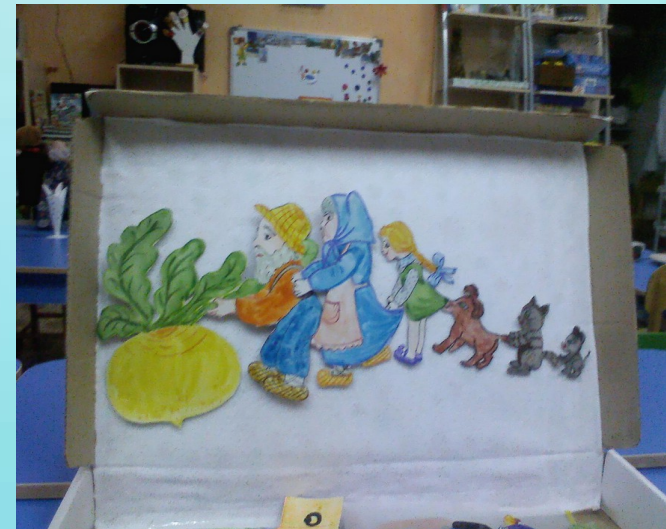
Театр на фланелеграфе