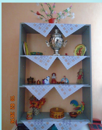
Музей прикладного искусства