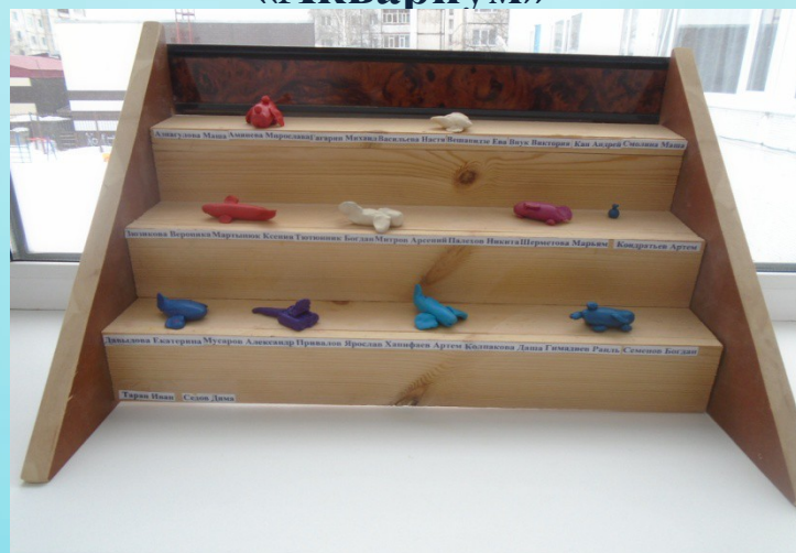
Подставка для работ по лепке