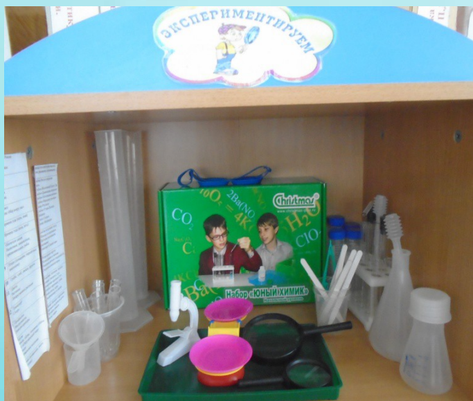
Мини-лаборатория с инструментами