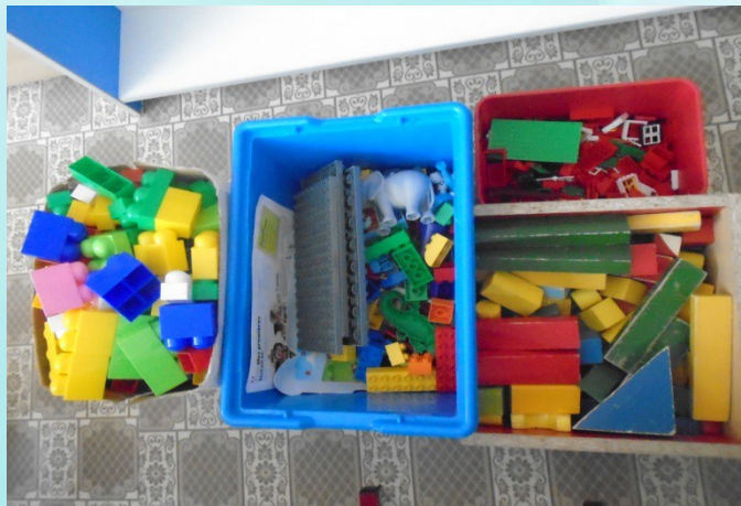
«Лего» крупный, средний, мелкий и строитель средний