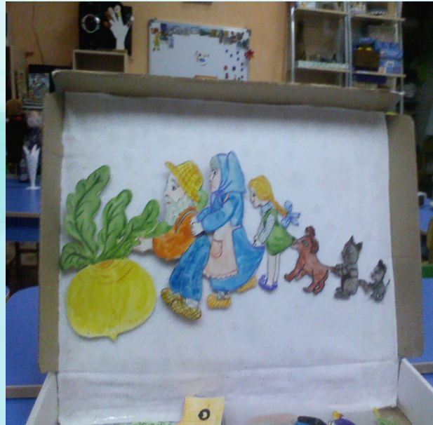
Дидактическая игра с использованием театра на фланелеграфе