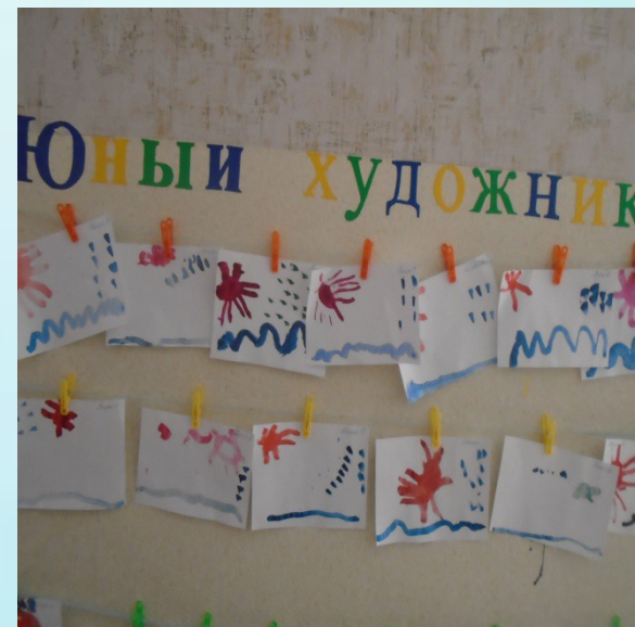
Выставка детских работ