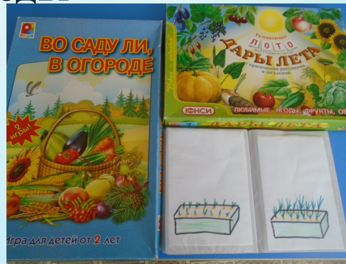
Дидактические игры, дневник наблюдений