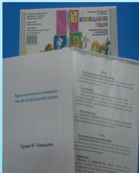
Картотека опытов и исследований