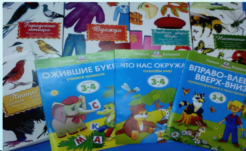
Дидактические игры по развитию речи