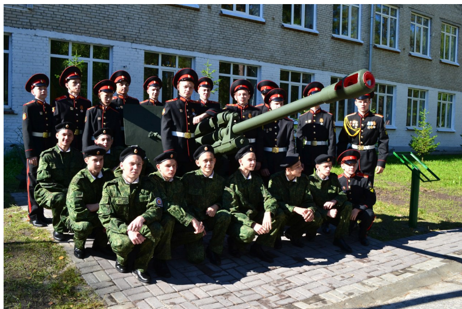
День знаний – 1 сентября 2016 года.