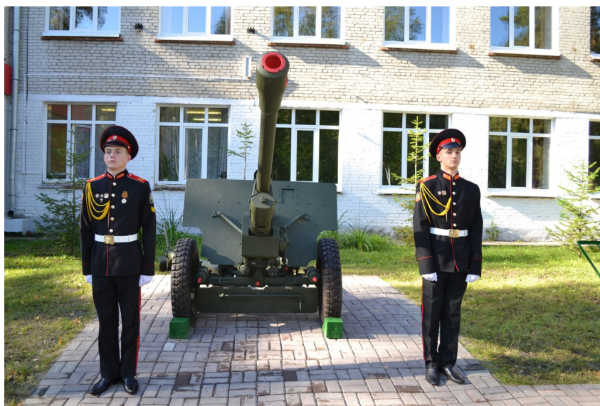
Почетный караул у противотанковой пушки ЗИС – 3.