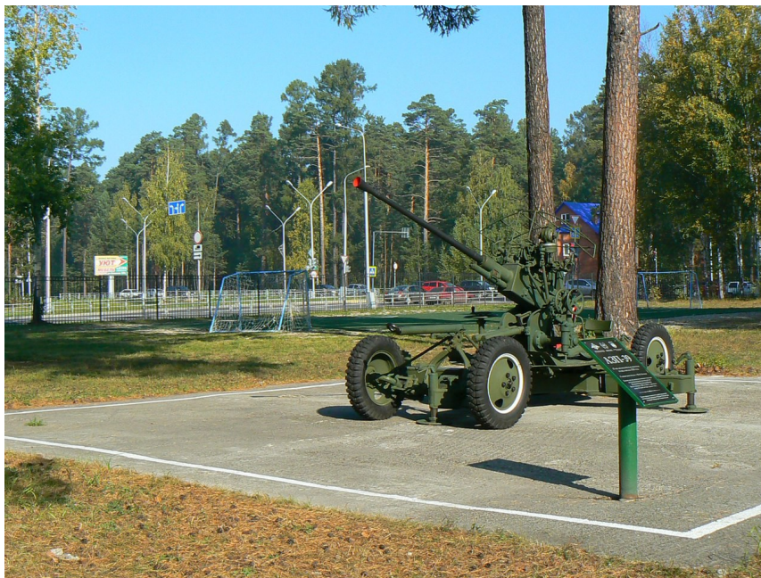
Автоматическая зенитная пушка АЗП – 39 образца 1939 года на территории Северского кадетского корпуса

Воспитание у школьников гордости за своё Отечество, его героическое прошлое и настоящее, готовности встать на защиту Родины была и остается одной из важнейших задач патриотического воспитания молодежи.