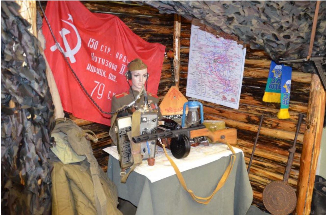
Фрагмент фронтовой землянки.