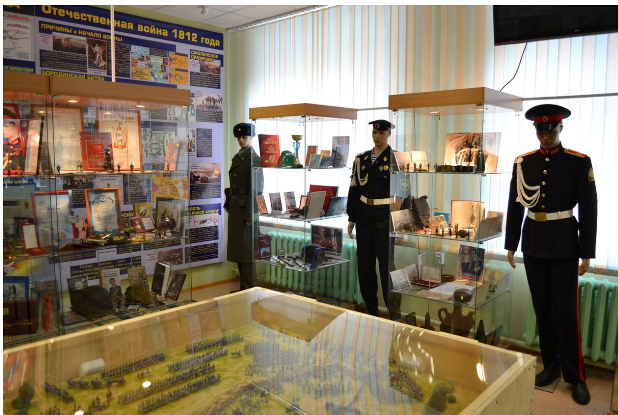
В центре экспозиции музея панорама Бородинского сражения 1812 года.