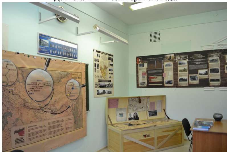
Устноисторический методический центр.