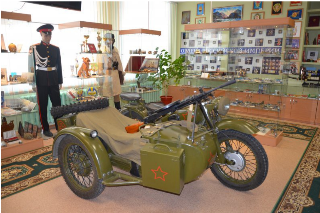
В центральной части экспозиции разведывательно-десантный мотоцикл М – 72 образца 1942 года (найден и реставрирован поисковиками музея).