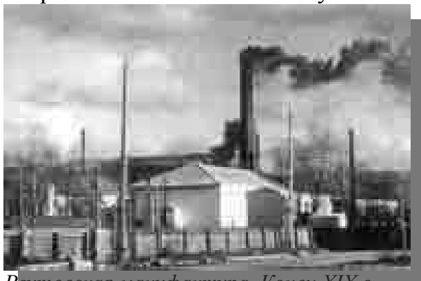
Реутовская мануфактура. Конец XIX в.

рождения старейшего градообразующего предприятия, ныне ЗАО "Реутовская мануфактура". Уже в 1831 г. за выпускаемую пряжу оно на Всероссийской выставке получило большую золотую медаль.