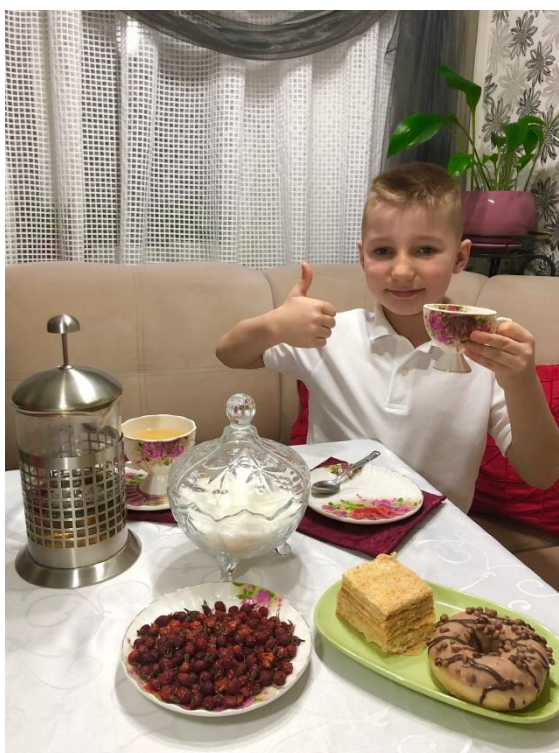
Чай из шиповника!