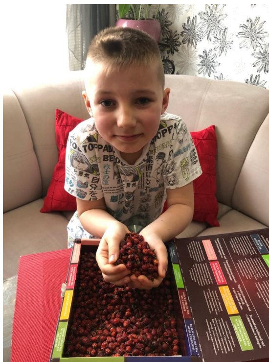
Домашняя заготовка шиповника.