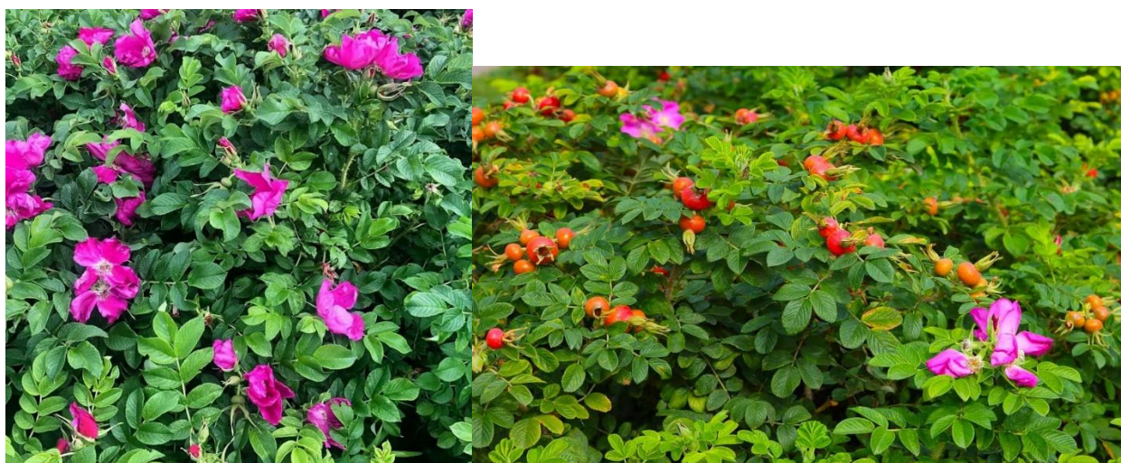
Цветки и плоды шиповника.