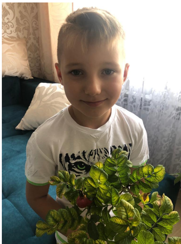
Я и шиповник!