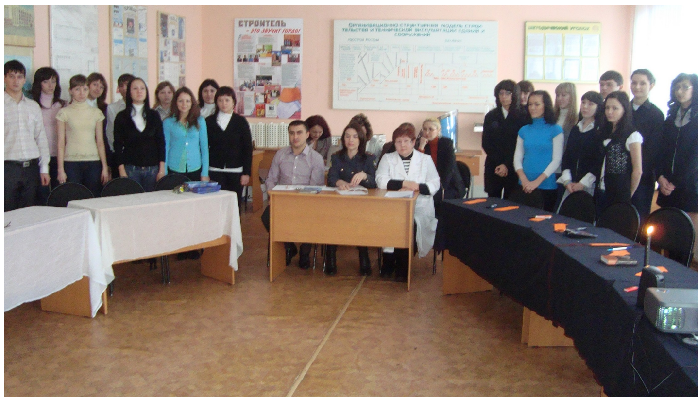
Открытый классный час в группах 4Сд 56 и 2Сд 59 на тему «Наркомания: мифы и реальность».