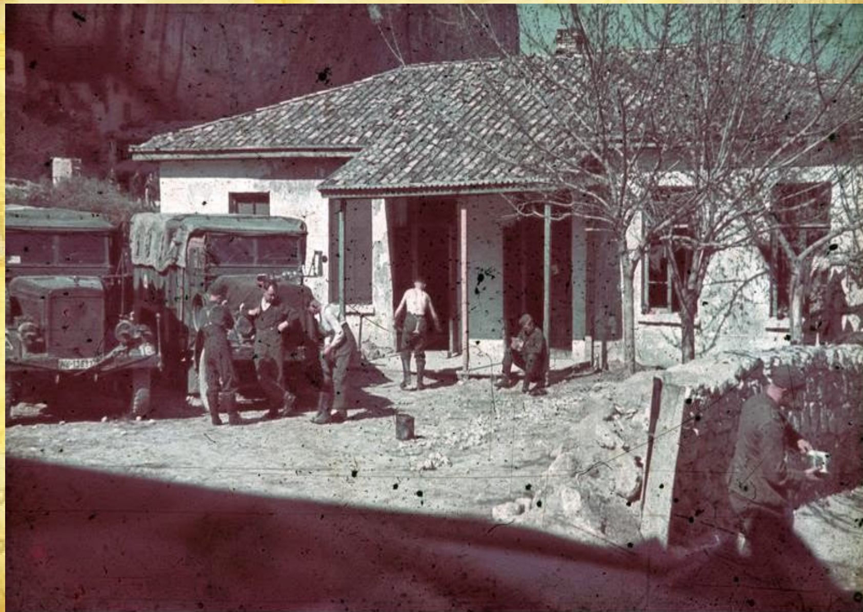
Bundesarchiv, N 1603 Bild-102 Foto: Grund, Horst | 1942 ca.