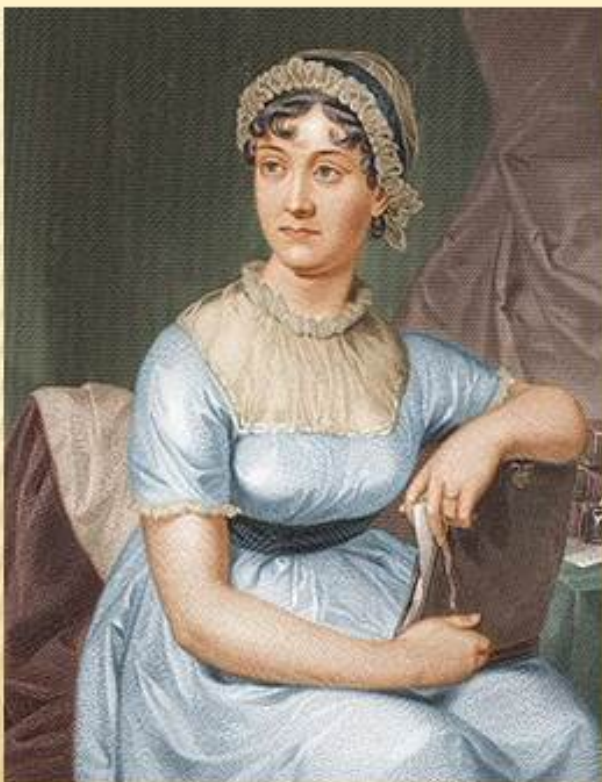
Джейн Остин 1775 — 1817г. английская писательница, провозвестница реализма в британской литературе, сатирик, писала романы нравов.

Настоящее признание пришло к Джейн Остин лишь после смерти.