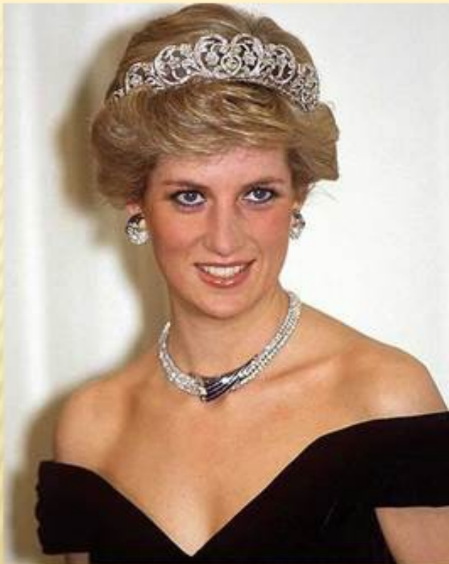
Диана Френсис Спенсер 1961 – 1997г. с 1981 по 1996 первая жена принца Уэльского Чарльза, наследника британского престола.

Также Диана была награждена рядом наград.