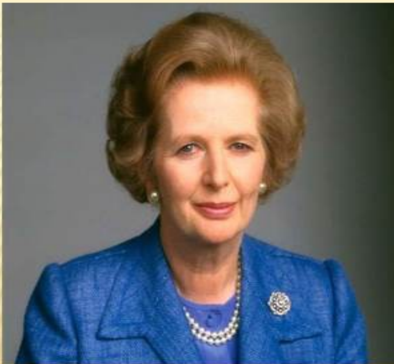
Маргарет Хильда Тэтчер 1925 – 2013г. 71-й премьер- министр Великобритани и в 1979— 1990 годах, баронесса с 1992 года.

Премьерство Тэтчер стало самым продолжительным в XX веке , со времён Солсбери (1885, 1886—1892 и 1895—1902) и самым продолжительным непрерывным пребыванием в должности со времён лорда Ливерпуля (1812—1827). Журнал Time включил Маргарет Тэтчер в сотню выдающихся людей 20-го века в категории «Лидеры и революционеры»