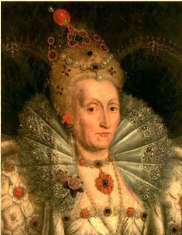
Елизавета I 1533 – 1603г. королева Англии и королева Ирландии с 17 ноября 1558, последняя из династии Тюдоров.

Время правления доброй королевы Бесс, как величали Елизавету I современники, называют «Золотым веком Англии». Последняя из монархов династии Тюдоров сумела поднять Британию на новую ступень развития и укрепить позиции страны на мировой арене. Во время правления младшей дочери Генриха VIII творили Уильям Шекспир , Кристофер Марло и Френсис Бэкон. Их называют «елизаветинцами» из-за покровительства королевы искусству и культуре.