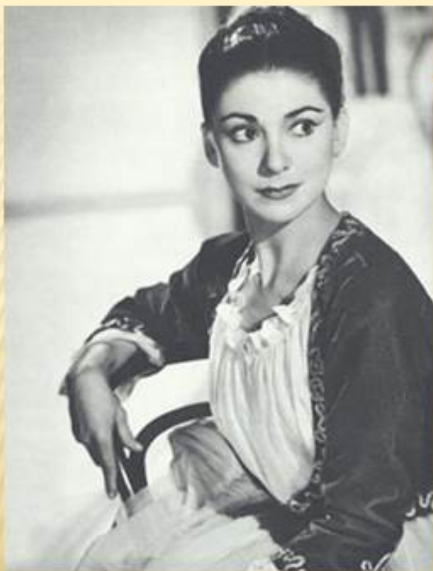
Марго Фонтейн 18 мая 1919 – 21 февраля 1991г. выдающаяся английская балерина.

В 1996 году почта Великобритании выпустила почтовую марку с её изображением.