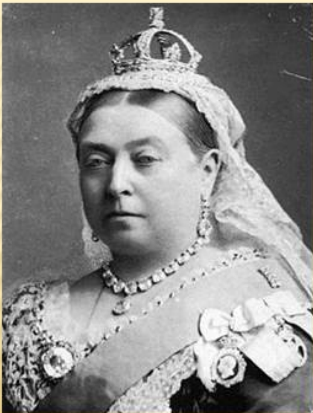
Королева Виктория 1819 – 1901г. Королева Великобритании и Ирландии с 1837 г., императрица Индии с 1876г.

Ее эпоха вошла в историю государства под названием «Золотой век».